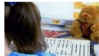
Strangers in Chats (english version)