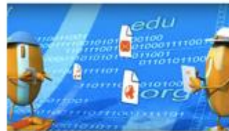
Insafe Spot SID 2012