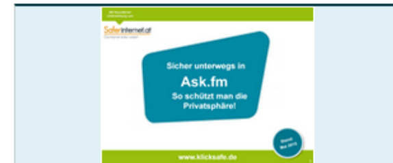
Leitfaden: Sicher unterwegs in Ask.fm