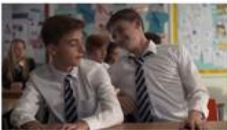
Zu weit gegangen