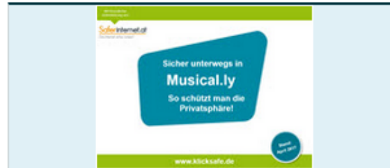
Leitfaden: Sicher unterwegs in Musical.ly

Die EU-Initiative für mehr Sicherheit im Netz