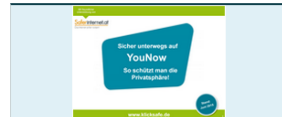
Leitfaden: Sicher unterwegs auf YouNow

http://www.klicksafe.de/service/schule-und-unterricht/leitfaeden/