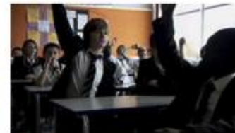
Let's fight it together (Mit deutschen Untertiteln)