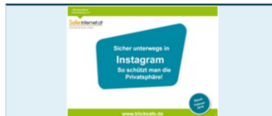
Leitfaden: Sicher unterwegs in Instagram