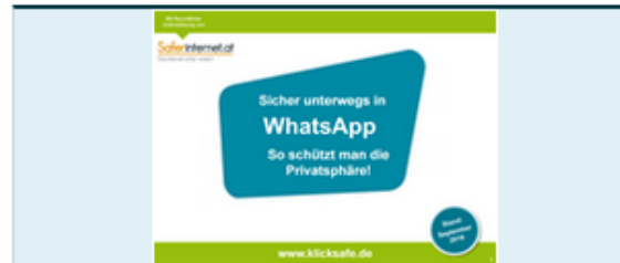
Leitfaden: Sicher unterwegs in WhatsApp