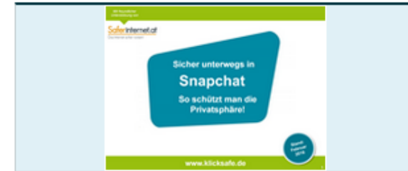
Leitfaden: Sicher unterwegs in Snapchat