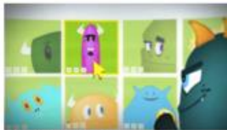
Insafe Spot SID 2013