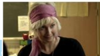
Elternsprechtag (english version)